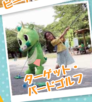
ターゲット・ バードゴルフ