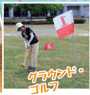
グラウンド・ ゴルフ